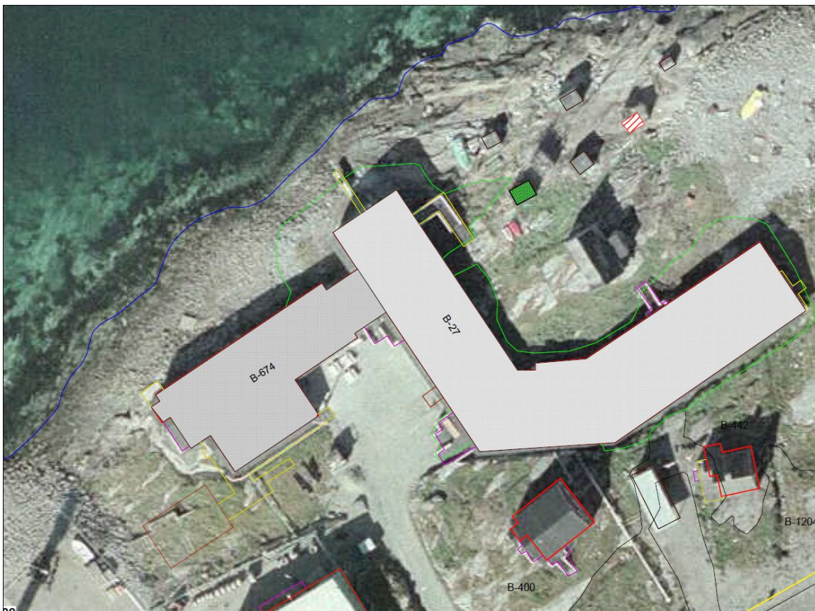
Asseq 1 Massakkut utoqqaat illuata inissisimavia.

Sanatitsisup atuisullu kissaatigaat utoqqaat illuat nutaaq massakkut pioreersup inissisimavianit nuunneqassanngitsaq.