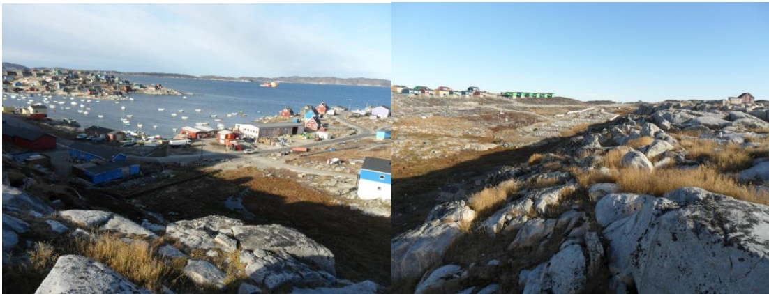
Asseq 3 Sumiiffik C 3 Sparip tunuani immap oqaluffiullu tungaanut isikkivilik.

Sumiiffimmi C 3-mi utoqqaat illuat nutaaq inissineqassaaq taamaalilluni immap tungaanut kii-salu iliveqarfimmut isikkiveqarsinnaaniassammat.